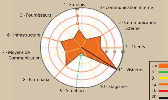
Graphique de vulnérabilité de l'entreprise X

RISQUE ÉCONOMIQUE = VULNÉRABILITÉS x MENACES